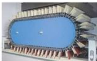
Multimaster brusných jednotek - nechte výsledek broušení